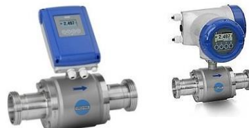
Tube Sensor tipo Sanitário Versão Compacta

Teclado óptico. Possibilita alterar a configuração e a parametrização sem a necessidade de abrir o invólucro do Medidor pode ser protegido com senha.